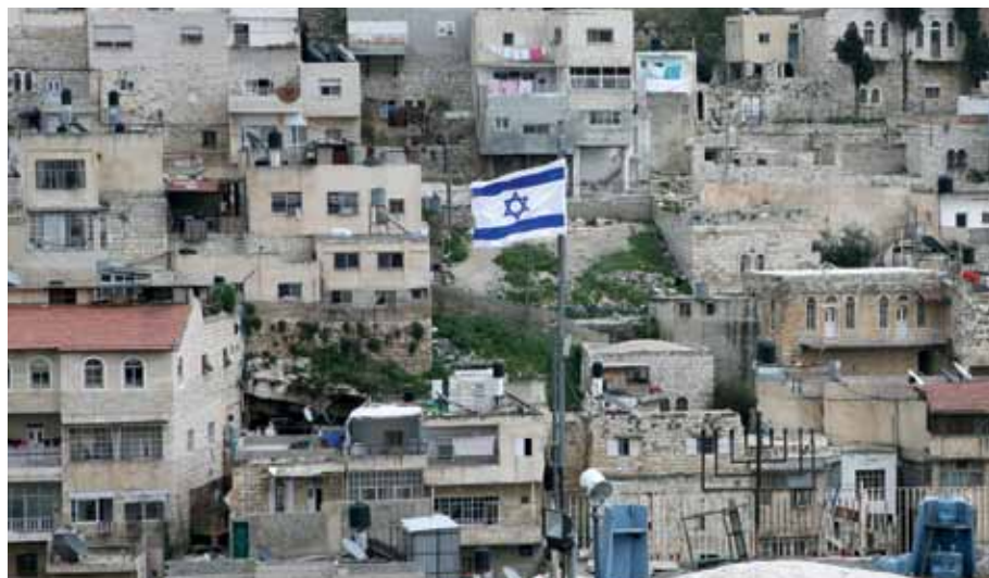
Bosættelse midt i palæstinensisk kvarter i Østjerusalem

Israellerne har nu annekteret mere end 42 % af Vestbredden, og palæstinenserne er f.eks. snart helt fordrevet fra Jordandalen, som er inddraget til israelske landbrugs-